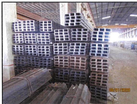
HOT ROLLED SECTIONS OF NON –ALLOY STRUCTURAL STEEL (150 X 75 X 6.5)MM X 6M