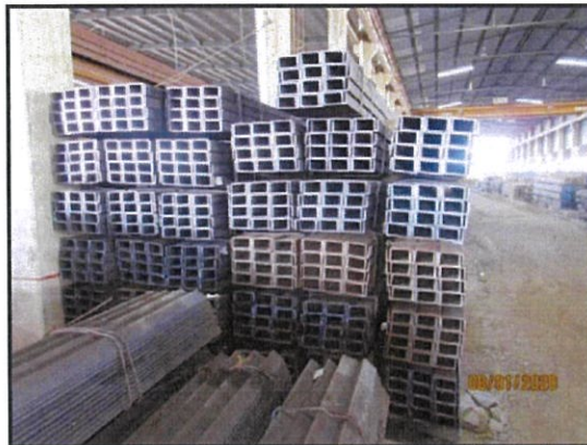
HOT ROLLED SECTIONS OF NON –ALLOY STRUCTURAL STEEL (150 X 75 X 6.5)MM X 6M